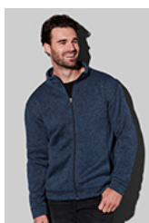
ST5850 Knit Fleece Jacket